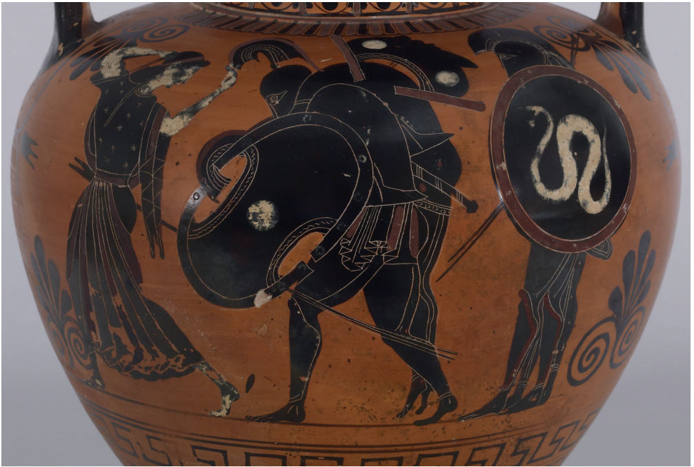
Ajax draagt het lichaam van Achilles, vaas van Antimenes, 6e eeuw v. Chr. (publiek domein)

bekrachtigd door de plek die het in onze levens en beleving inneemt.