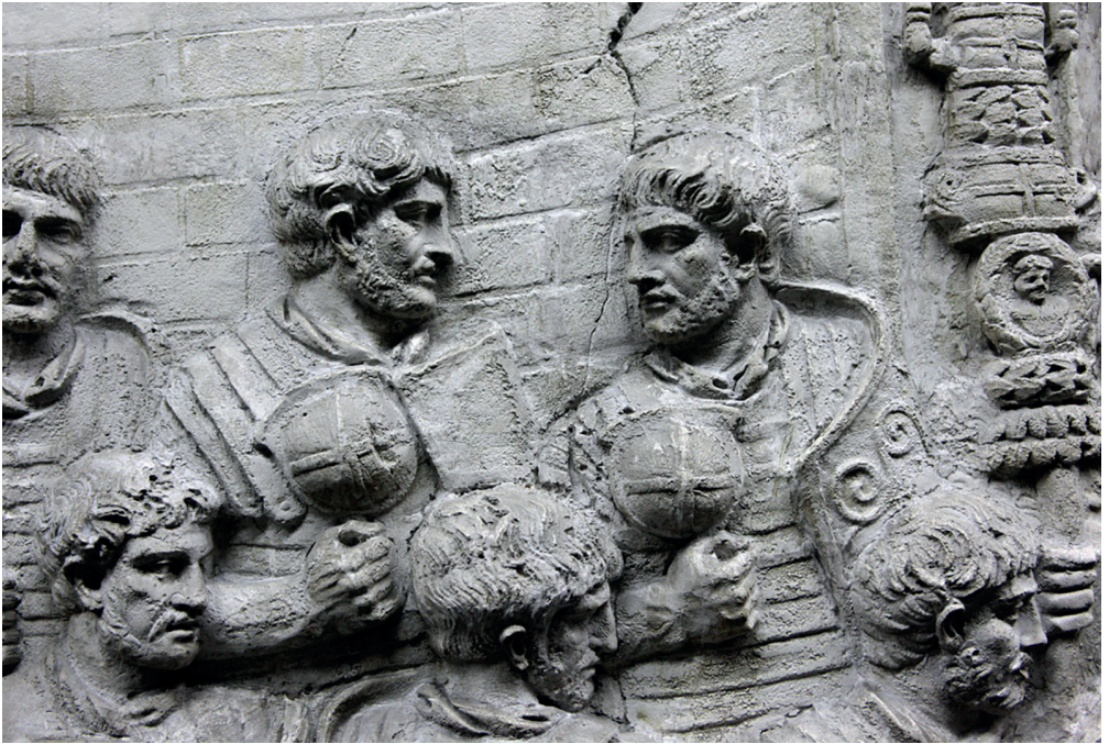
Twee Romeinse soldaten kijken elkaar aan tijdens de Dacische Oorlogen, zuil van Trajanus, 2e eeuw n.Chr.

Aeneas en Livius' geschiedenis van de Romeinen. De lichamelijke reacties die de dreiging van de dood teweegbrengt – de trillingen, verstarringen en slapeloosheid – ontgingen zelfs de hooghartigste Romeinse oorlogsverhalen niet. We treffen het aan in de vooravonden van grote oorlogen en veldslagen, en in de nadagen. Van pandemieën van angst in de legerkampen, tot aan tot wanhoop gedreven veteranen die uit kwelling hun huizen in brand steken en zichzelf van het leven beroven. Het waren verhalen die voor de Romeinse jongeman op school verplichte kost waren. De psychologische tol van oorlog en geweld moet hen bekend zijn geweest.