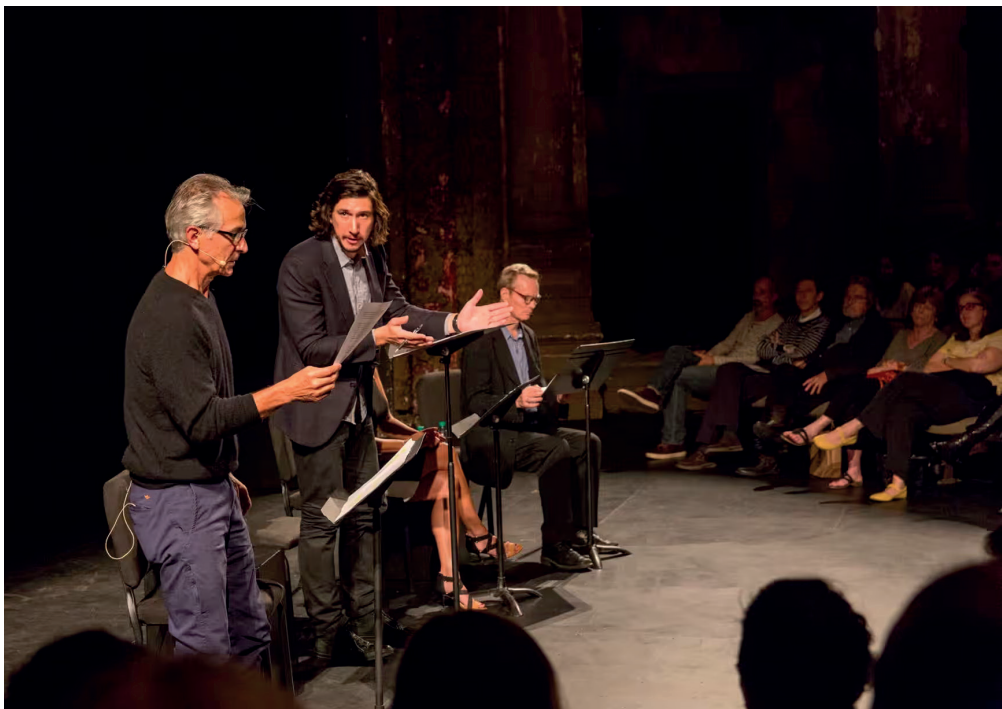
Acteurs spelen Sophocles' Ajax in het Amerikaanse Theatre of War

– ervaringen die, tenslotte, hoogst intiem waren. Niemand zou immers écht kunnen begrijpen wat oorlog met hen heeft gedaan. Het moest leiden tot discussie in de zaal, over oorlog en of de universele ervaring bestaat. Maar die discussie, die ontstond niet. Er werd geknikt, meegeleefd en ook gehuild. Het eeuwenoude stuk van de Atheense tragicus had zijn glans nog niet verloren. Er heerste een gevoel in de Amsterdamse zaal, alsof er een transcendent begrip van de menselijke ervaring was bereikt. Alsof alle grenzen van tijd en plaats voor even vervaagden. De mens was op zijn menselijkst. En trauma was het woord.