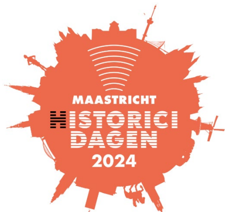
Logo van de Historicedagen 2024

Het KNHG organiseert deze conferentie, die in augustus 2024 in Maastricht zal plaatsvinden, in samenwerking met de Universiteit Maastricht, de Open Universiteit en Fontys. Het thema van deze editie is Ongedisciplineerde Geschiedenis .