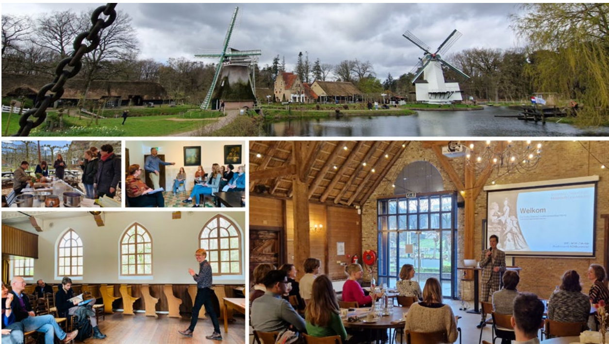
Fotocollage KNHG-Voorjaarscongres 2023, Arnhem

Het Voorjaarscongres Ruiken. Proeven. Doen. Historisch onderzoek met je zintuigen vond plaats op vrijdag 13 april in het Nederlands Openluchtmuseum te Arnhem. Het congres werd georganiseerd in samenwerking met NL-Lab van het KNAW Humanities Cluster en het Meertens Instituut . Het ochtendprogramma stond in het teken drie verschillende Ronde Tafels, waarin deelnemers in gesprek gingen over het gebruik van performatieve methoden in de praktijk.