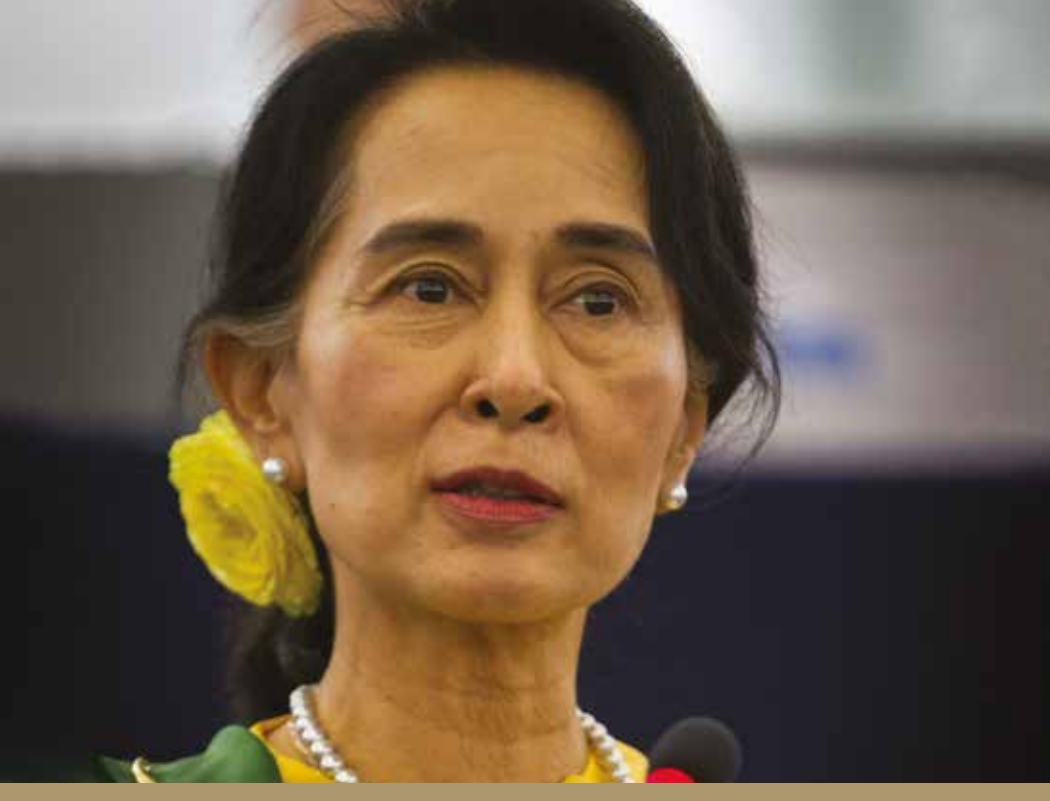
Veranderlijke morele oordelen: Aung San Suu Kyi (foto: Claude Truong-Ngoc, 2013)