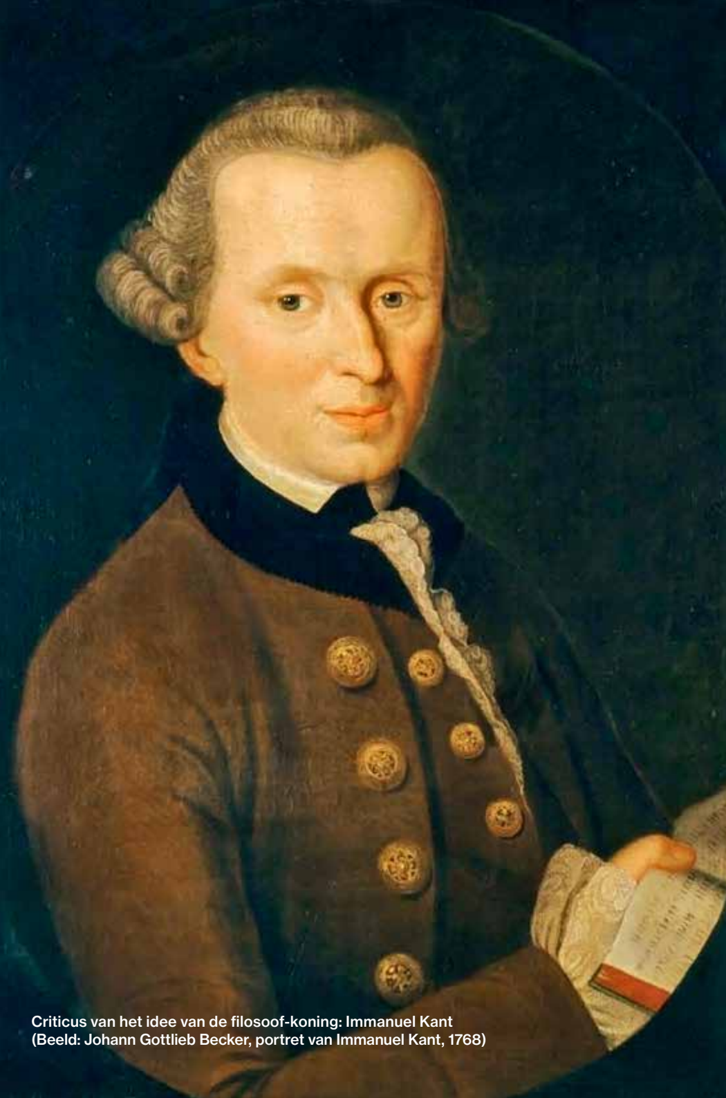
Criticus van het idee van de filosoof-koning: Immanuel Kant (Beeld: Johann Gottlieb Becker, portret van Immanuel Kant, 1768)