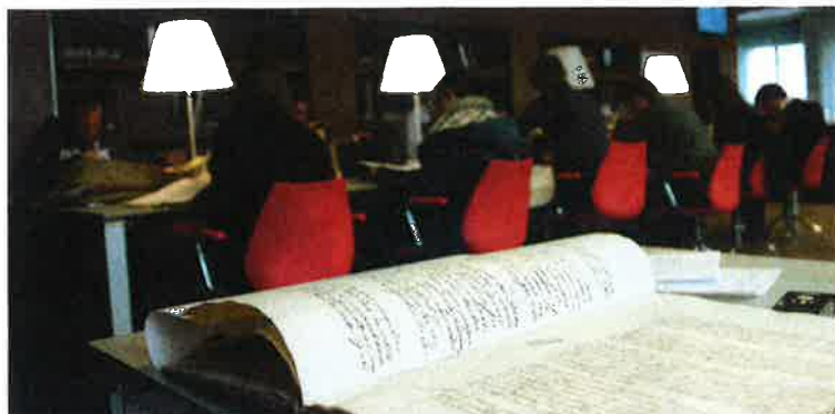
Studeerzaal Algemeen Rijksarchief, Brussel.

Engelhard: 'Ik hoor weinig van medewerkers die in en met Indonesië werken dat deze kwestie momenteel aan de orde is. Ik vind niettemin dat we ons beter moeten voorbereiden op mogelijke verzoeken tot restitutie.' Velle en Engelhard benadrukken het belang van het herkomstbeginsel: daar waar een archief is gevormd, hoort het thuis. Toch zal restitutie niet altijd