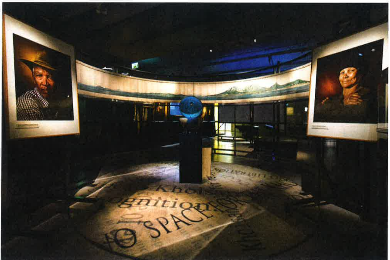
Tentoonstelling ‘De Wereld van de VOC’, 2017, Nationaal Archief, Den Haag.

Opmerkelijk aan de Belgische situatie, en dit staat in groot contrast tot Nederland, is dat deze archieven lange tijd bij het ministerie van Buitenlandse Zaken bewaard zijn gebleven en