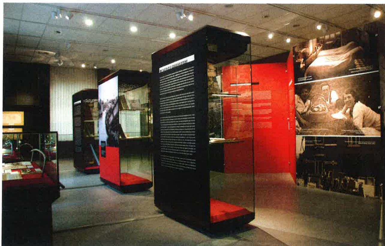
Tentoonstelling in Algemeen Rijksarchief, Brussel.