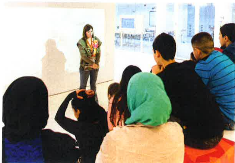
Educatie in het Nationaal Archief.