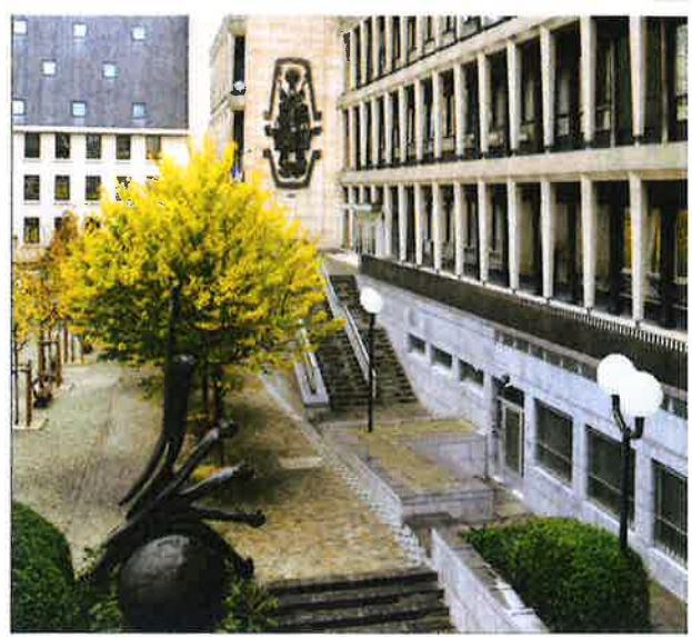
Aanzicht Algemeen Rijksarchief, Brussel.

Velle wijst erop dat de archieven van de koloniale periode niet alleen uit staatsarchieven bestaan, maar ook uit private archieven van missiegenootschappen, politici, ambtenaren, wetenschappers en bedrijven. Het Belgisch Rijksarchief bewaart 12 kilometer aan staatsarchieven. 3,5 kilometer omvat de