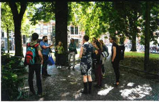
Wandeling langs sporen van het slavernijverleden.