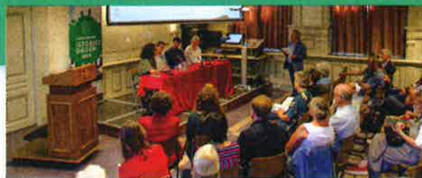
De Historicidagen 2019 werden van 22 tot en met 24 augustus in Groningen gehouden, op initiatief van de KNHG in samenwerking met de Rijksuniversiteit Groningen.