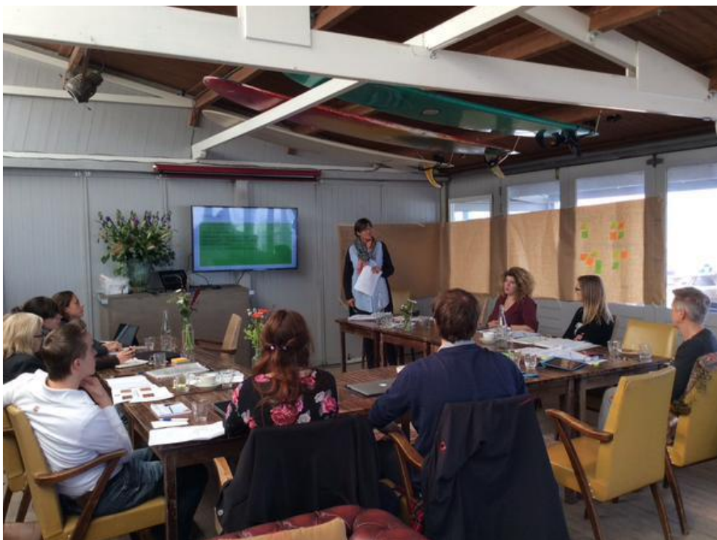
Een brainstorm sessie met medewerkers van het KNHG-bureau (september 2015)

Najaar 2015 startte KNHG ook met een strategietraject dat in 2016 moet resulteren in een plan voor een succesvolle ledencampagne. We willen een aantrekkelijke vereniging zijn en blijven voor historici. Hiervoor is het nodig dat de vereniging groeit, vernieuwt en vooral verjongt. Hoe sluiten we aan bij de behoeftes van jonge historici? Gegevens over de huidige situatie en over de belangrijke maatschappelijke ontwikkelingen zijn gecombineerd met de resultaten van een klein vooronderzoek onder huidige en vooral potentiële leden: ' Luisteren naar historici '. Op grond daarvan is door bestuur en bureau een missie en visie geformuleerd, en zijn strategische keuzes gemaakt ten aanzien van doelgroep, producten en diensten. De afronding van het traject vindt plaats in 2016: duidelijk is wel al dat participatie en betrokkenheid van leden bovenaan staan en er een 'Jong KNHG' wordt opgericht.