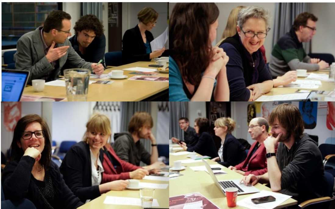
Eerste bijeenkomst correspondenten www.historici.nl

KNHG en Huygens ING werkten in 2015 samen verder aan de ontwikkeling van de website www.historici.nl : dé startpagina voor professionele historici voor informatie en actualiteit, die daarnaast toegang biedt tot een schat aan digitale resources en een platform voor online discussie en samenwerking. Begin 2015 ging het correspondentennetwerk van start: historici uit onderzoek, archief, museum en onderwijs, fungeren als ambassadeurs voor de site en schrijven regelmatig blogs. Een andere belangrijke vernieuwing in 2015 is het onderdeel Geschiedenis & Actualiteit . Naar voorbeeld van het Engelse History & Policy bieden historici hier op basis van hun wetenschappelijk onderzoek een kritische reflectie op actuele, maatschappelijke kwesties. De bezoekersaantallen namen in 2015 gestaag toe (peildatum december 2014: 4125; januari 2016: 5838), het bereik via sociale media is groot (Twitter 3200; LinkedIn 1090; Facebook 980).