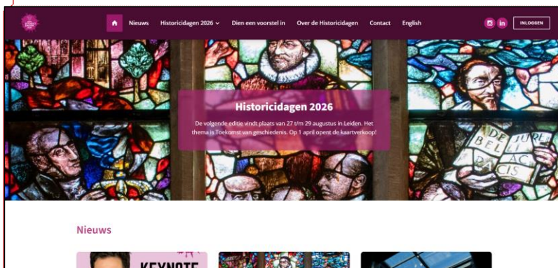
Homepage van Historicidagen.nl (screenshot van 12 februari 2026)

In september 2025 is de website Historicidagen.nl gelanceerd voor de vijfde editie van de Historicidagen. Deze website is compleet vernieuwd en is gekoppeld aan de nieuwe KNHG-website. De website wordt in aanloop naar de Historicidagen 2026 gevuld met nieuws, het programma en andere voor deelnemers en sprekers relevante informatie. De oproep tot bijdragen is in oktober 2025 gepubliceerd, dit is direct gekoppeld aan de abstract-site die op hetzelfde systeem draait.