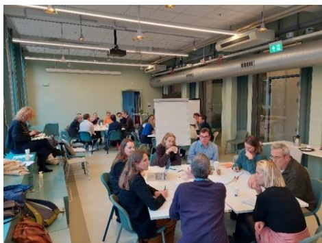
De expertmeeting over Records in Contexts

Op 16 december organiseerde het KNHG een expertmeeting, samen met de Universiteit van Amsterdam, het Huygens Instituut en het Stadsarchief Amsterdam (SAA), waar historici hun zoekmethoden en strategieën presenteerden aan vertegenwoordigers van het SAA. Aanleiding voor deze bijeenkomst was de ontwikkeling van een nieuw zoekstelsel, Records in Contexts , door het SAA (zie ook 3.2.3. Strategie: Beroepsvereniging ).