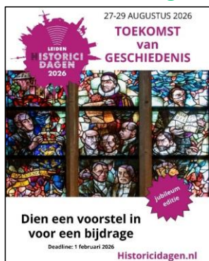
Flyer met de oproep tot bijdragen

In 2025 is gestart met de organisatie van de Historicidagen 2026. Deze vijfde editie vindt van 27 tot en met 29 augustus plaats in Leiden. Het KNHG werkt voor de organisatie van deze editie samen met de